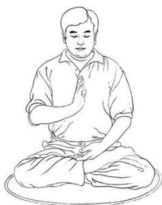
Tenendo un palmo eretto Fa Zheng Qian Kun Xie E Quan Mie