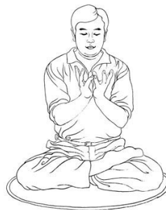
La posizione della mano di loto Fa Zheng Tian Di Xian Shi Xian Bao